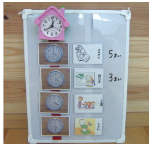
コミュニケーション・ツール

個別支援は、それぞれのお子さんに適した方法を、保護者の方と相談しながら提供します。また、会話や意思表示が苦手なお子さんには、絵カードやコミュニケーション・ツール等を使用し、コミュニケーションがとれるように努めます。