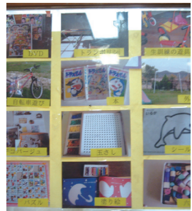
絵カードで意思表示