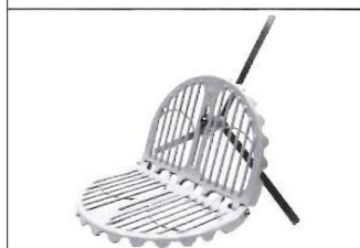
L型ストレーナー(大)