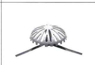
A型ストレーナー(小)