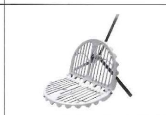
L型ストレーナー(小)