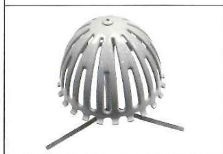
A型ストレーナー(大)