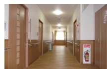
車イスでも広々な廊下