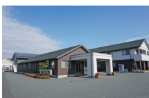
こすかたの郷全景