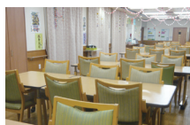
テイルームで生き生き元気