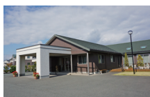
こすかたの郷全景