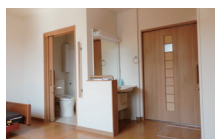
収納・洗面・トイレ付の居室