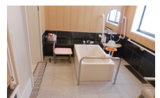
楽々介助の三方浴槽