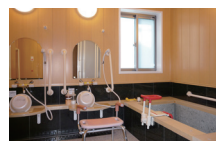
ヒノキ香る広々浴室