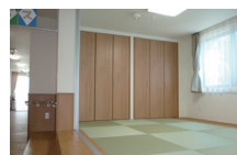
和室でのんびりテイルーム