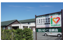
ケアビレッジの案内板