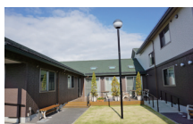
ウッドデッキと芝生