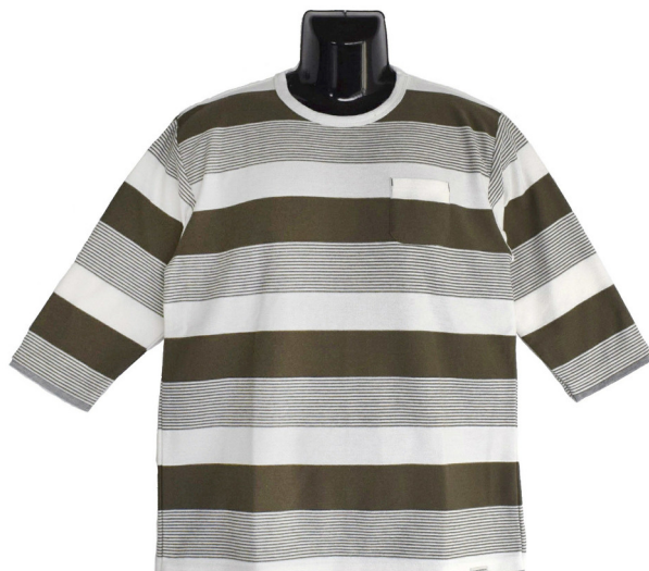
スラブタック天竺×天竺 編み変えボーダー 7分袖 フェイクレイヤード Tシャツ

大きめのパッチポケットが特徴的なカーディガン感覚で羽織れるコートです。持ち運びもかさばらず便利！ブルー（弱ブリーチ）とネイビー（ワンウォッシュ）の2色に加え、サックス（ブリーチ）を追加しての3色展開です。