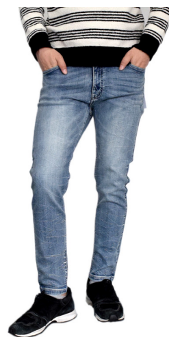
機能素材 SHELTECH ストレッチデニム ジョガーパンツ

編みこみ調の型押しPUを使用したロングウォレットです。シックなカラーでフォーマルにも相性抜群。味わい深い表情で使い込みたくなる色合いです。カードポケット（8箇所）、マチポケット付きで、コンパクトなのに大容量収納できる使い勝手抜群のおすすめウォレットです。