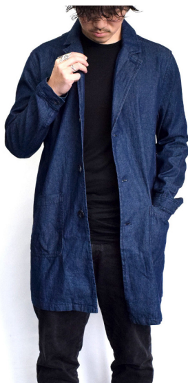
60Zデニム チェスターコート

大きめのパッチポケットが特徴的なカーディガン感覚で羽織れるコートです。持ち運びもかさばらず便利！ブルー（弱ブリーチ）とネイビー（ワンウォッシュ）の2色に加え、サックス（ブリーチ）を追加しての3色展開です。