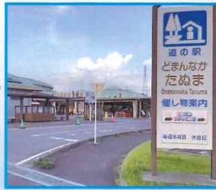
工務部 『道の駅 どもんなかためま』

野菜の直売所はもちろん、グルメや足湯などいろいろ楽しめる道の駅! 1番のポイントは、日本列島のど真ん中に位置する場所なので「今、日本の中心にいる!!」という高揚感を味わえるのが魅力です。