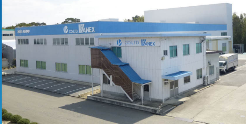
▲ プレスセンター外観

自動倉庫の設置により、 材料在庫のシステム化と 温度管理の徹底を行って います。