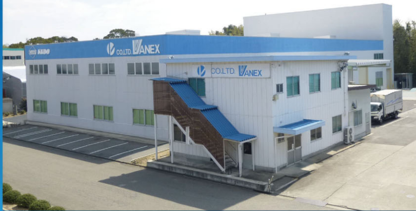
▲ プレスセンター外観