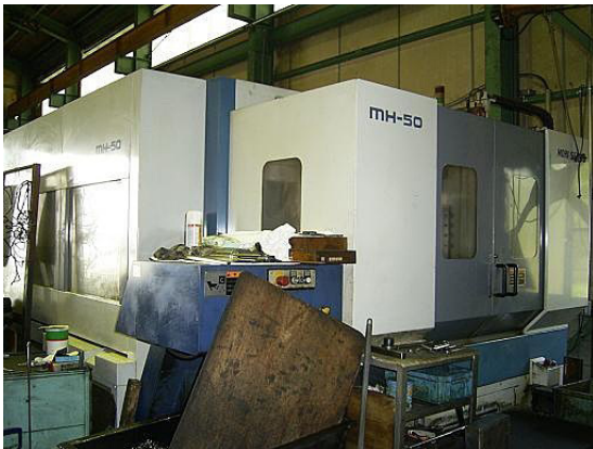
MORISEIKI製 形式 MH-50 (横型) 台数 1台

X軸移動量 (パレット左右) (mm) 800Y軸 移動量 (主軸頭上下) (mm) 650Z軸移動 量 (コラム前後) (mm) 750