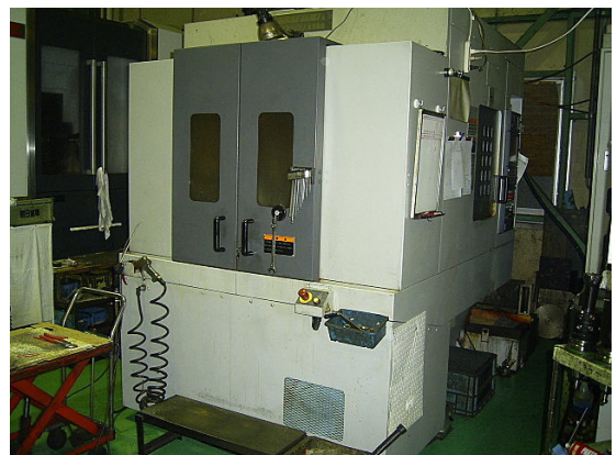
MORISEIKI製 形式 ACCUMILL4000 (立型) 台数 1台

X軸移動量 (パレット左右) (mm) 800Y軸 移動量 (主軸頭上下) (mm) 650Z軸移動 量 (コラム前後) (mm) 750