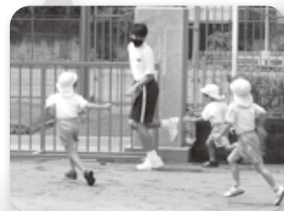
～彩の国ボランティア体験プログラム事業～

福祉教育活動の支援 彩の国ボランティア体験プログラム事業 ボランティア活動への助成