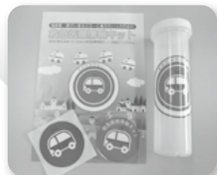
～救急医療情報キット～