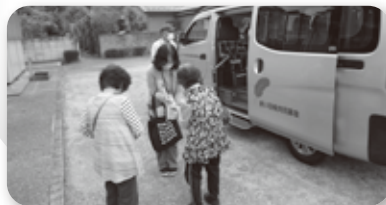
～買い物移動支援サービス事業～

買い物移動支援サービス事業 歳末激励事業 認知症予防事業(認知症予防ケア教室) 認知症啓発事業(オレンジカフェ)