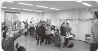
～障がい者団体交流会～

障がい者団体の育成及び活動助成 紙おむつの配布 視覚障がい者に対する朗読奉仕事業 障がい者団体交流事業