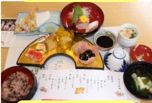
ケアハウスはなうみ苑