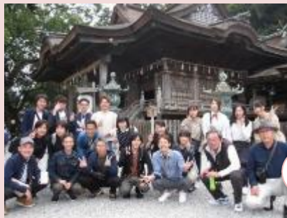
2019年研修旅行(小豆島班)