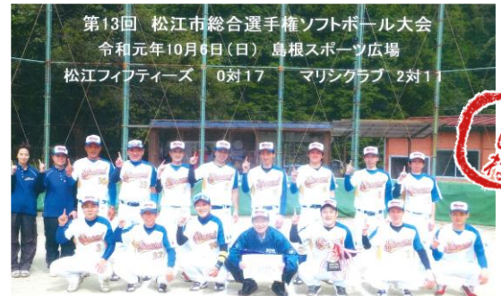
優勝 社会福祉法人 みずうみ