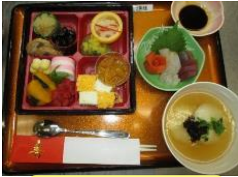
特別養護老人ホームうぐいす苑

お正月といえば、おせち料理！！ 今年も各施設、心のもったおせち料理で新しい 年を迎えて頂きました。