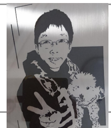
ステンレス似顔絵