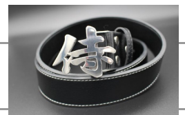
漢字バックルベルト