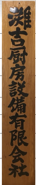
創業当時の社名板