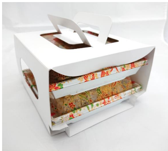
角皿（H-16）2段用紙ケース