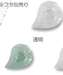
エメラルド グリーン