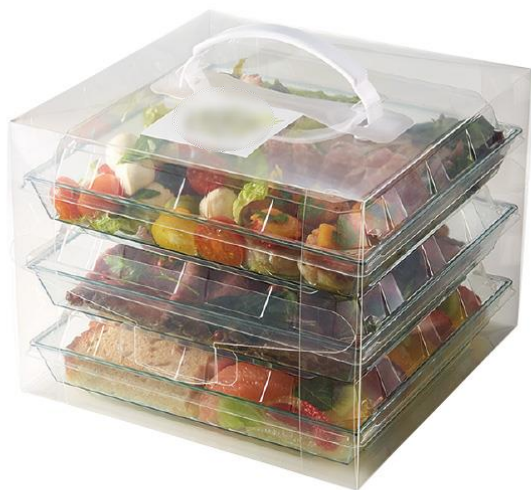
角皿（特小）2段/3段取っ手付きケース 角皿（20）2段/3段取っ手付きケース