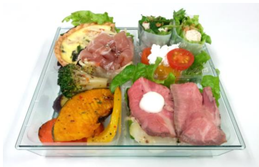
角皿 (H-16) エメラルドグリーン/H-16用4個仕切 (透明)