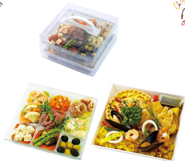
角皿（H-20） / H-20用 9個仕切透明（PPFもございます）