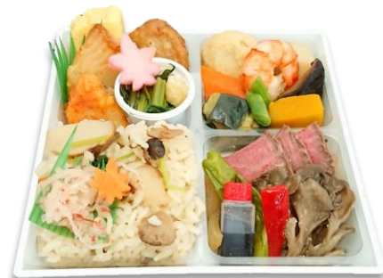
角皿 (H-16) PPT/H-16用4個仕切 (PPF)