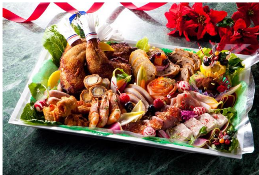
▶ 旬彩 (特大) 白磁