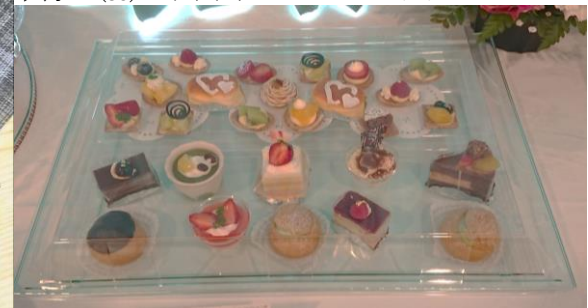
▶旬彩(特大) エメルトグリーン