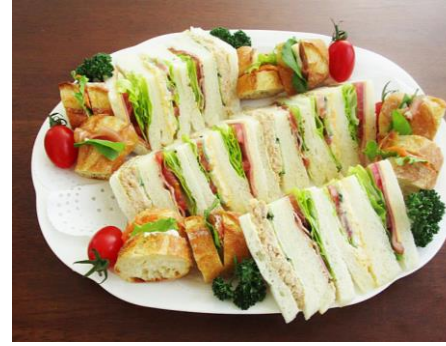
▶ シルキー (大) アイボリー