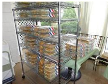
フタがあるのでストック可能♪