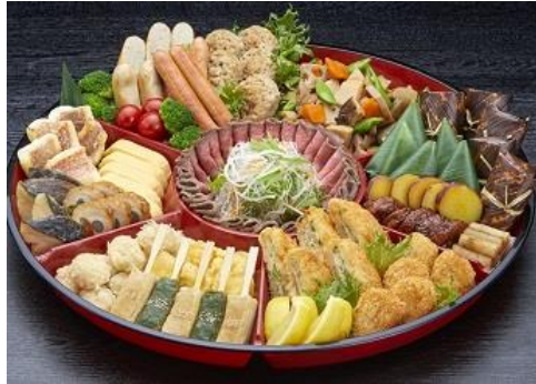
▶ オードブルNM (48) 黒子