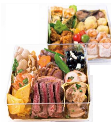
▶ 飛鳥本体 (6.5寸) 透明