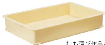
持ち運び作業が楽♪