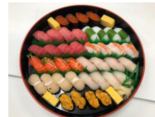
▶ 市松 (40) 黒赤丹