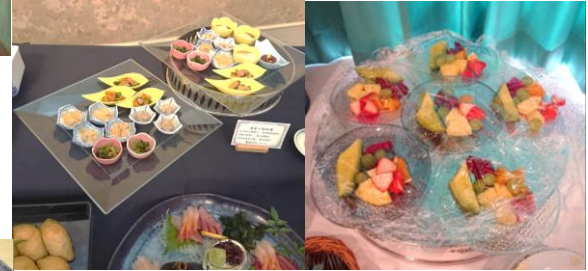
▶角皿(30) エメルトグリーン