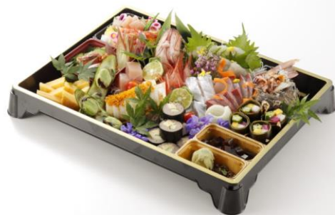
▶新ひぜん盛(中) 黒金牙