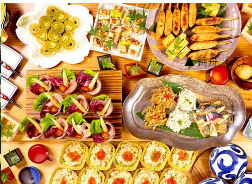
▶いろどり初仕/角皿(H-20) 白磁/実(36) 釉/宴(中) 工芸陶器