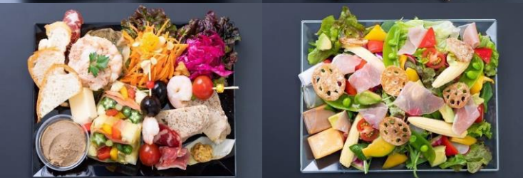
▶ 角皿 (特小) エメラルドグリーン / (特小) 3段BOX