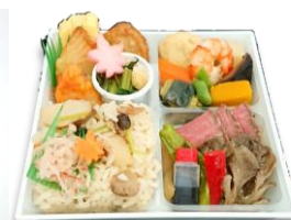
▶ 角皿 (H-16) PPT / H-16用4個仕切 (P P F)