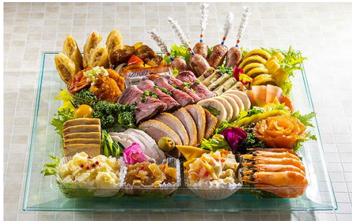
▶ 角皿 (中) スイグルー