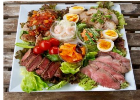
▶ 角皿 (35) 白磁