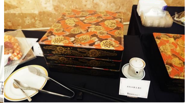
▶飛鳥本体・7丈(1尺) 御所車