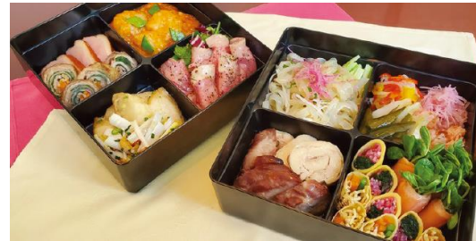
▶ 飛鳥本体 (6.5寸) 黒