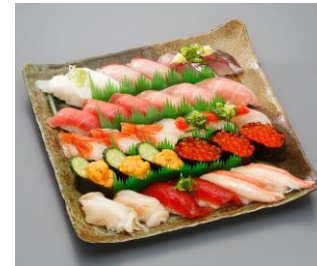
▶ 筑後 (35) 民芸陶器