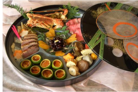
▶ 飛鳥 (35) 本体黒/7タじゃの目傘