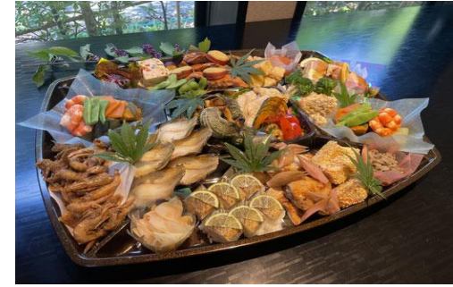
▶ オードブルNK (51) ゴールド