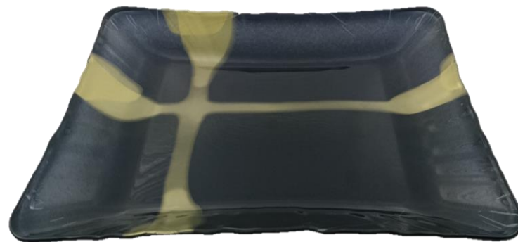
ブラックゴールド