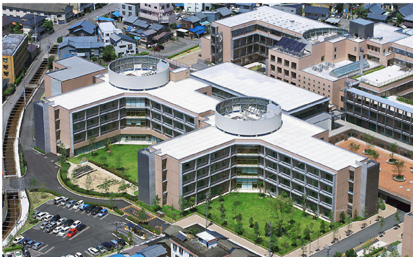
福井県立病院整備事業第二期建設工事(全体)

医療技術の目覚ましい発達や高齢化社会の到来は、施設そのものに大きな変革をもたらしつつあります。当社では、施設の企画段階からブレーンとして加わり、医師や関係者らのニーズを充分把握した上で、利用者の立場に立った施設計画を検討。将来の設備更新や、設備管理システムの変化に柔軟に対応できる体制を整えるなど、高度な専門性と技術力を要求される医療施設や福祉施設の建築に対して、万全の施工プランを臨んでいます。