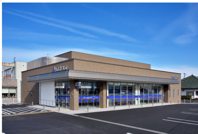
福井銀行種池支店新築工事