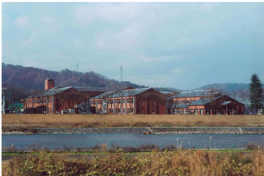
南条小学校校舎新築工事

学校をはじめとした教育施設の建築内容は、社会の変化や子供たちの意識の変化とともに、その内容も大きく変わってきています。とりわけ重要視されているのが、環境を考えた資材の利用や、耐震・対価などの安全性、そして毎日の学校生活を楽しく過ごすことができるような快適性です。特に日常頻繁に利用する場所においては、当社の長年の経験と実績によって培われたさまざまなノウハウが活かされています。