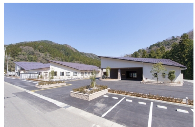
こうの（特養）新築工事