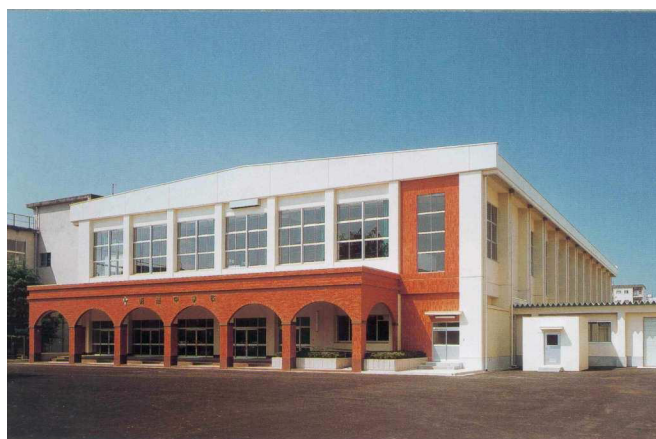
明道中学校体育館改築工事