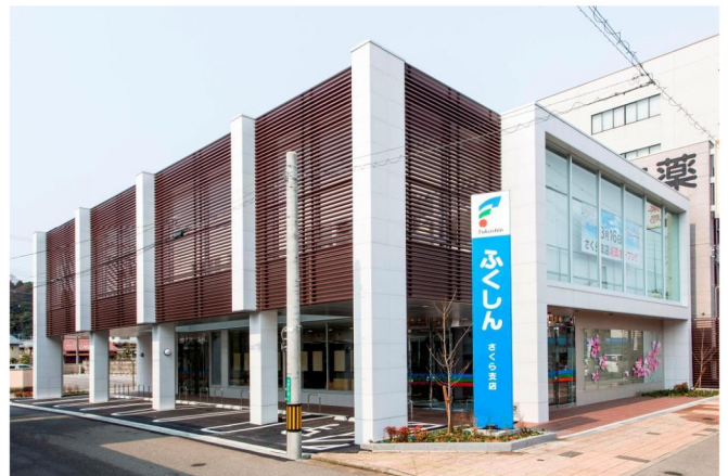
福井信用金庫さくら支店新築工事