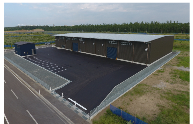
(株)ジャパンパワーボトラーズ