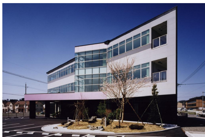
金沢エンジニアリングシステムズ(株)

会社の社屋や工場、倉庫の建設など、企業建設全般に関することも当社の得意分野です。この分野ではコスト対策もさることながら、日常の仕事をよりスピーディーに、より効率よく行うための、独創的な企画設計、レイアウトが求められています。当社では、まず現状の問題などを把握した上で、そこからお客様が求める姿をイメージし、デザイン設計をしています。数々の実績に基づいた当社独自のノウハウをベースに、高い品質を維持しながら、お客様のビジネスをサポートしています。