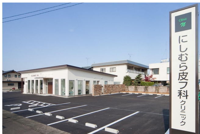
にしむら皮膚科クリニック