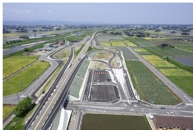
東海北陸自動車道 南砺スマートIC工事