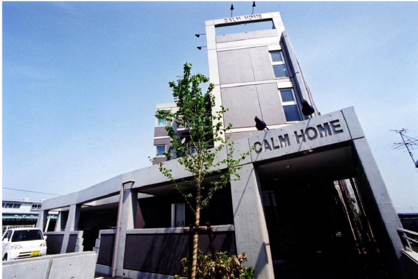
カームホーム (CALM HOME) 新築工事

低層の小型マンションから高層の大規模集合住宅まで、暮らしやすさを第一に考えた住宅建設。当社は、建築の分野でも、このように多彩な実績を築いてきました。高性能・高品質の技術を、企画・設計からアフターサービスにいたるまでトータルなシステムで提供することによって、施主の高い信頼を勝ち得ています。