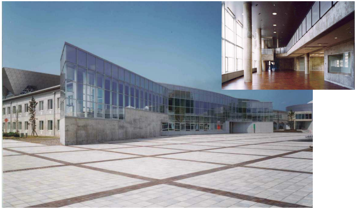
福井県立大学学生会館建築工事