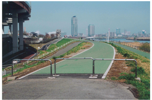
岩淵地区管内坂路整備工事 隅田川