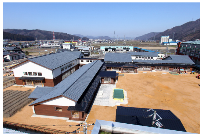
南条こども園園舎新築工事