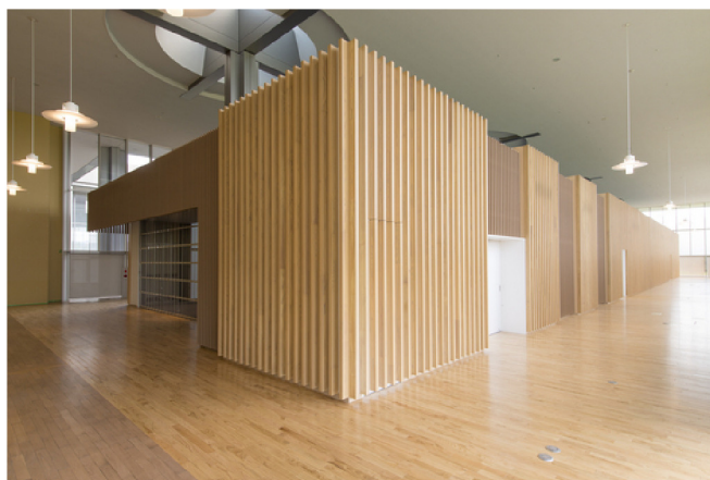
ふるさと文学館新築工事(福井県立図書館)