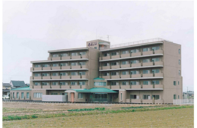
花しょうぶ（ケアハウス）新築工事