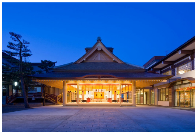
神明神社 神楽殿新築工事