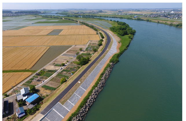
大安寺地区堤防拡幅工事 九頭竜川