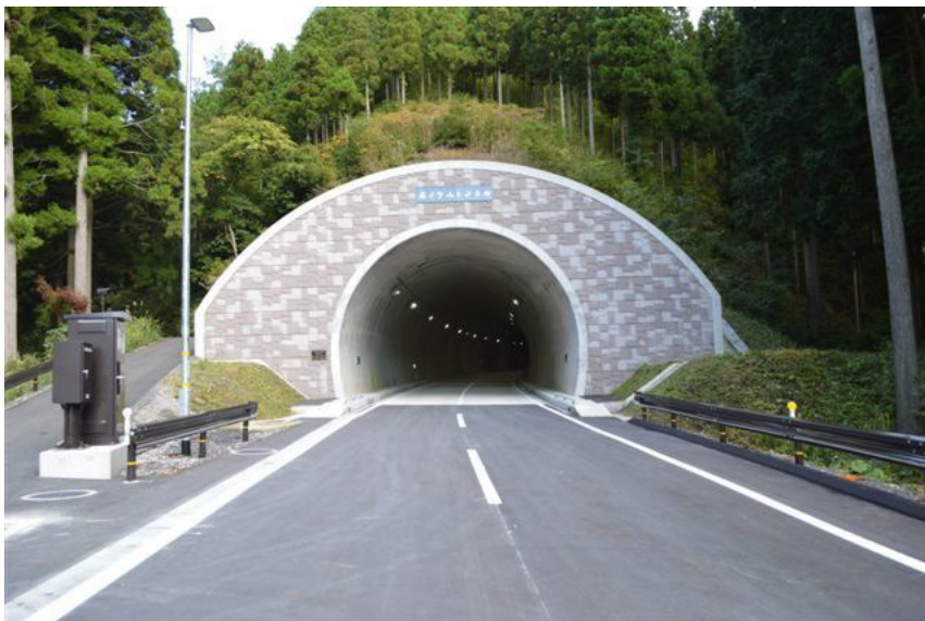
ホノケ山トンネル工事 河野工区

国土の自然形状を損なわないまま、増大する輸送需要にこたえるために、トンネル建設のニーズは高まりを見せています。