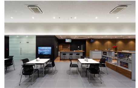
福井ヤナセ本社ビル新築工事