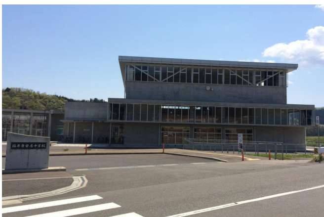
安居中学校校舎新築工事

学校をはじめとした教育施設の建築内容は、社会の変化や子供たちの意識の変化とともに、その内容も大きく変わってきています。とりわけ重要視されているのが、環境を考えた資材の利用や、耐震・対価などの安全性、そして毎日の学校生活を楽しく過ごすことができるような快適性です。特に日常頻繁に利用する場所においては、当社の長年の経験と実績によって培われたさまざまなノウハウが活かされています。