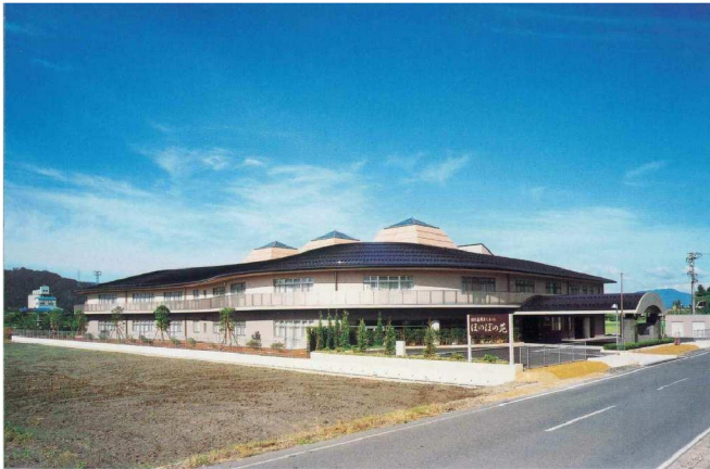
南条郡特別養護老人ホーム整備工事