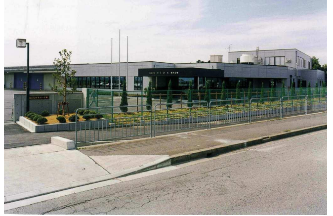
(株)にしばた 坂井工場