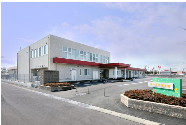
坂井松涛保育園新築工事