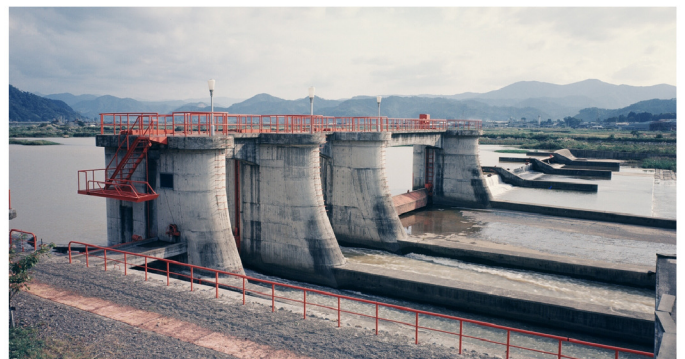
松ヶ鼻頭首工工事