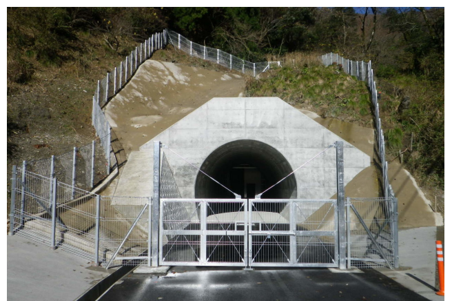
葉原トンネル工事