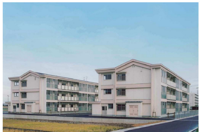
気比庄南団地 新築工事