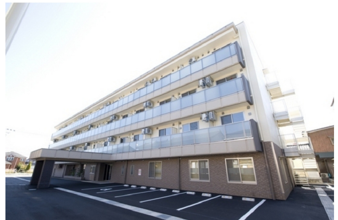
高齢者専用賃貸住宅江守きらめき 新築工事