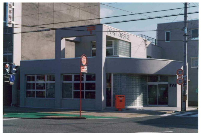
福井宝永郵便局新築工事