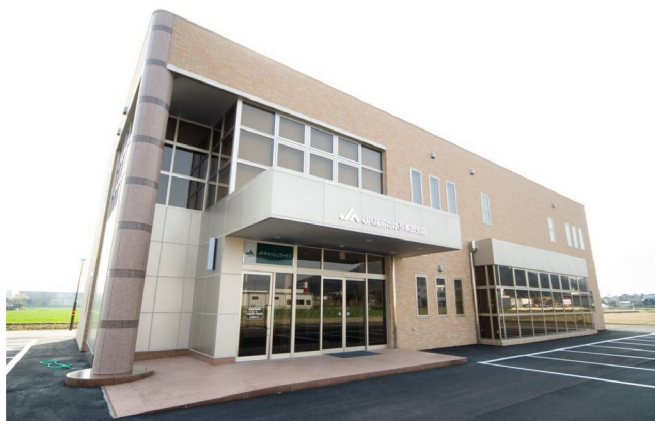
J A 越前たけふ 東部支店