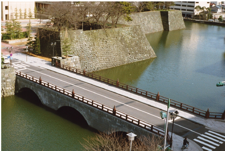
御本城橋架替工事（福井県庁）

海峡や航路を横断する渡海橋ばかりでなく、立体交差や高架橋など、陸上交通網の整備にとって橋梁の建設技術は不可欠なものとなっています。安全で経済的な設計・施工はもちろんのこと、最近では、わが国ならではの起伏に富んだ景観とも調和しながらも、地域の特性を生かしたグレードの高いデザイン性が求められています。