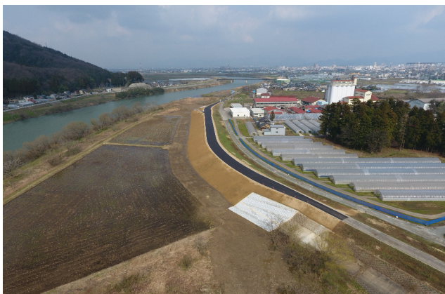
久喜津中流地区下河掘削工事 日野川