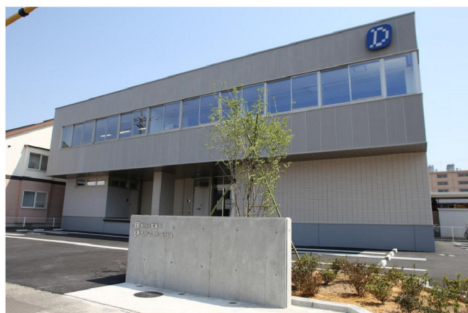
(株)電陽社福井営業所