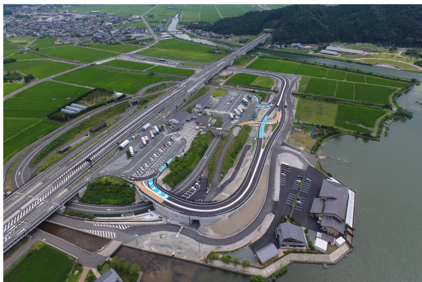
若狭舞鶴自動車道 三方スマートIC工事

経済の高度成長やモータリゼーションの進展と共に、わが国の道路網は発達してきました。さらに、道路整備の成長期といえる今、全国各地で次々に道路建設が行われています。当社は、その中でも有数のビックプロジェクトに参画し、自ら蓄積した建設技術をもとに多大な貢献を果たしています。時代の先端を行くレベルの高い施工技術は高く評価され、当社の信頼の一角を築いています。