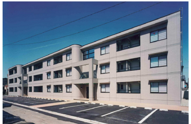
福井銀行宝永社宅 新築工事