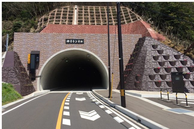
神子トンネル工事 小川工区

当社は、ダムや宅地造成・道路・河川護岸など、数々の建設工事によって培った土木技術のノウハウを、トンネル建設に活用。高度な技術を要するトンネル建設において多大の成果を上げると共に、輸送システムの高度化やネットワーク化を実現。地域の社会生活や産業の発展を推進しています。