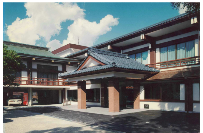
神明神社 儀式殿建築工事