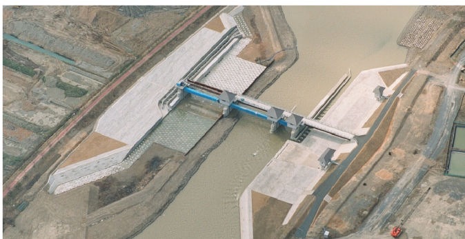
八乙女頭首工建設工事

環境を保全しながら水資源の確保や電力需要に応え、自然災害から暮らしを守るために、ダム建設のニーズはいま大きな注目を集めています。当社は、ロックフィルダム、アースダムなど、建設材料や構造の異なるさまざまなダムの建設において数々の実績を上げてきました。蓄積された技術力を基盤に、多角的な研究を重ね、工事の合理化を図る最新の材料・施工技術を柔軟に取り入れて、安全で経済的な工事を遂行しています。