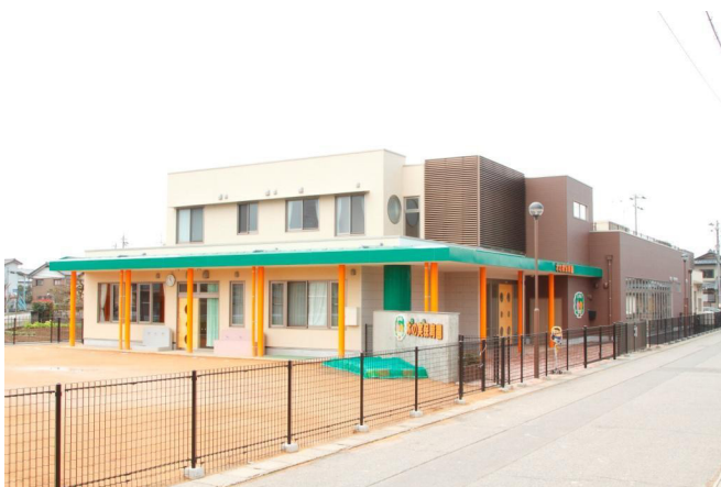
木の実保育園新築工事