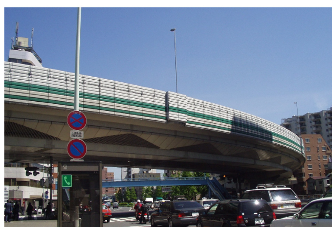
首都高速道路 遮音壁落下防止工事