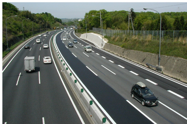
中国自動車道 山口地区登板車線設置工事