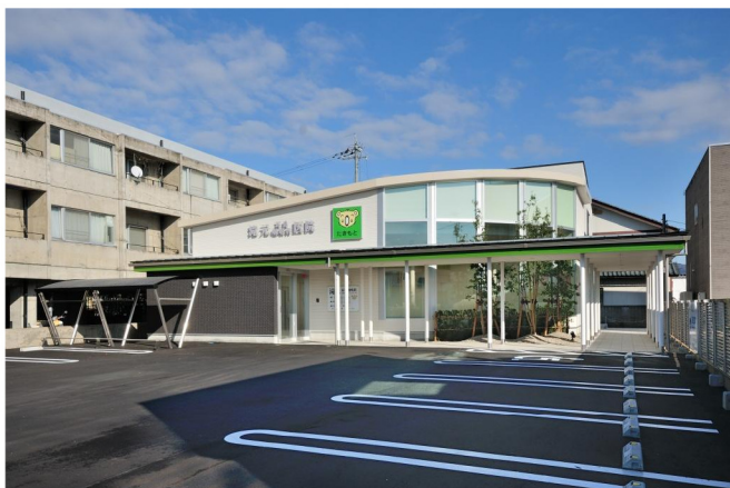
滝元耳鼻咽喉科医院新築工事

医療技術の目覚ましい発達や高齢化社会の到来は、施設そのものに大きな変革をもたらしつつあります。当社では、施設の企画段階からブレーンとして加わり、医師や関係者らのニーズを充分把握した上で、利用者の立場に立った施設計画を検討。将来の設備更新や、設備管理システムの変化に柔軟に対応できる体制を整えるなど、高度な専門性と技術力を要求される医療施設や福祉施設の建築に対して、万全の施工プランを臨んでいます。