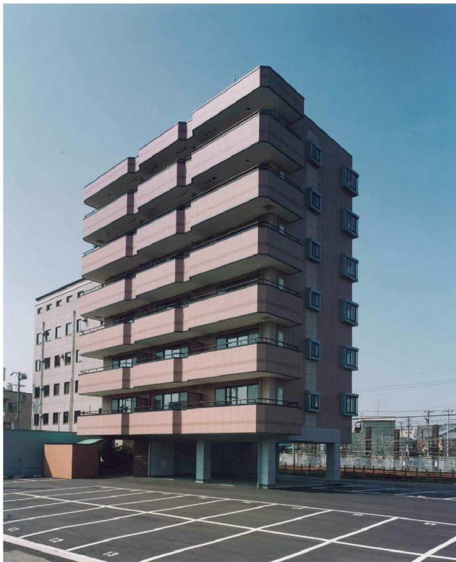
Hマンション新築工事

低層の小型マンションから高層の大規模集合住宅まで、暮らしやすさを第一に考えた住宅建設。当社は、建築の分野でも、このように多彩な実績を築いてきました。高性能・高品質の技術を、企画・設計からアフターサービスにいたるまでトータルなシステムで提供することによって、施主の高い信頼を勝ち得ています。