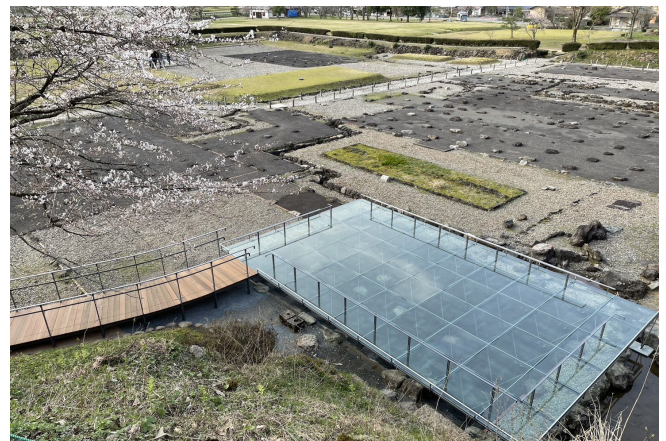
一乗谷朝倉氏庭園朝倉館跡再整備工事