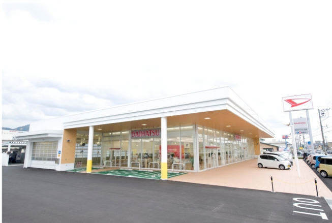
福井ダイハツ新浅水店新築工事

シンプルでありながらも、たくさんの人々の目を楽しませるようなデザインをコンセプトに…当社では、独創的なデザインはもちろんのこと、周辺環境の調和を最優先に考えた建築を基本にしています。特に商業施設の建築においては、デザインの良し悪しが、集客に影響することも少なくなく、十分なリサーチを行い、デザイン立案・設計・建築、そして、場合によってはプロデュースに至るまで総合的な視野に立ち提案し、建物と街づくりを目指しています。