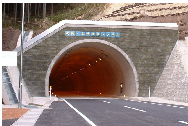
新大内トンネル工事