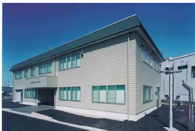
福井市ワークプラザ