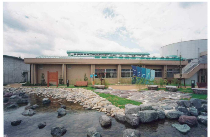
福井県内水面センター新築工事