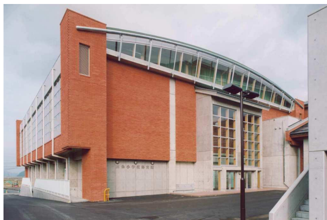
南条小学校屋内運動場他建設工事