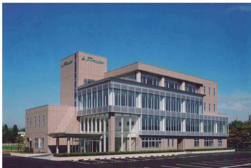
(株)アートテクノロジー

会社の社屋や工場、倉庫の建設など、企業建設全般に関することも当社の得意分野です。この分野ではコスト対策もさることながら、日常の仕事をよりスピーディーに、より効率よく行うための、独創的な企画設計、レイアウトが求められています。当社では、まず現状の問題などを把握した上で、そこからお客様が求める姿をイメージし、デザイン設計をしています。数々の実績に基づいた当社独自のノウハウをベースに、高い品質を維持しながら、お客様のビジネスをサポートしています。