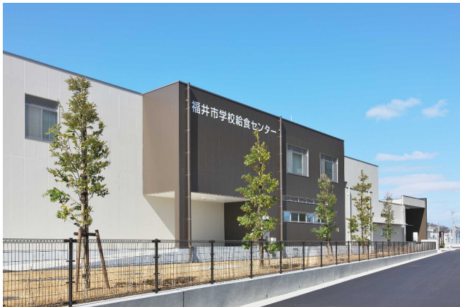
福井市学校給食センター新築工事

当社は、福井県など自治体の依頼により公共施設の建築を数多く担当してきました。コミュニティセンター、学校を始めとする教育施設など、質の高い施工技術を活かして建設された施設の数々は、地域住民にも親しまれ高い評価を得ています。これらの豊富な実績を基板に人々の多様なニーズに応えながら、未来に誇りうる共有財産としての建造物を目指し、より良い社会や文化の形成に役立っていきたくと願っています。