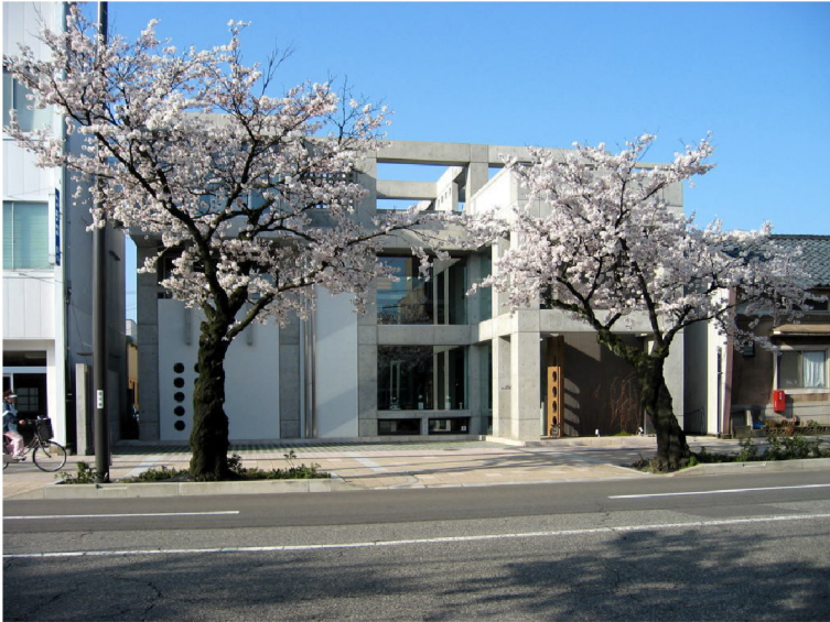
ジュエリースカラベ新築工事（福井市都市景観賞）

シンプルでありながらも、たくさんの人々の目を楽しませるようなデザインをコンセプトに…当社では、独創的なデザインはもちろんのこと、周辺環境の調和を最優先に考えた建築を基本にしています。特に商業施設の建築においては、デザインの良し悪しが、集客に影響することも少なくなく、十分なリサーチを行い、デザイン立案・設計・建築、そして、場合によってはプロデュースに至るまで総合的な視野に立ち提案し、建物と街づくりを目指しています。