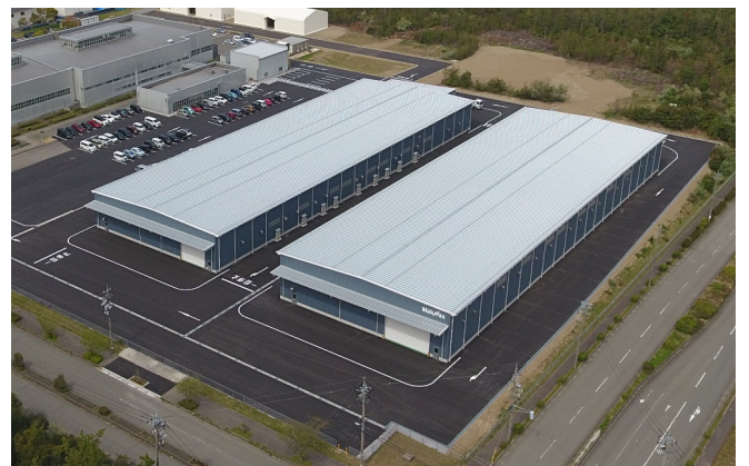
太陽工業(株) 福井工場