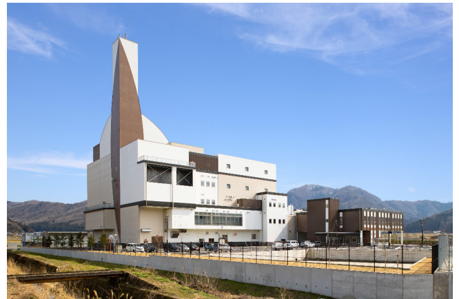
南越清掃組合新ごみ処理施設整備・建設工事