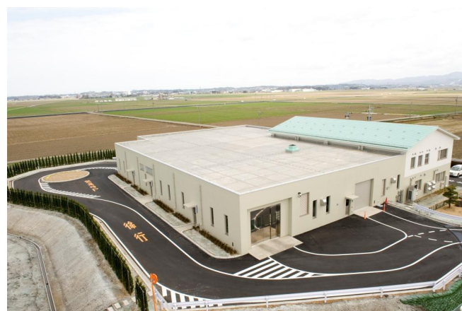
坂井汚泥センター