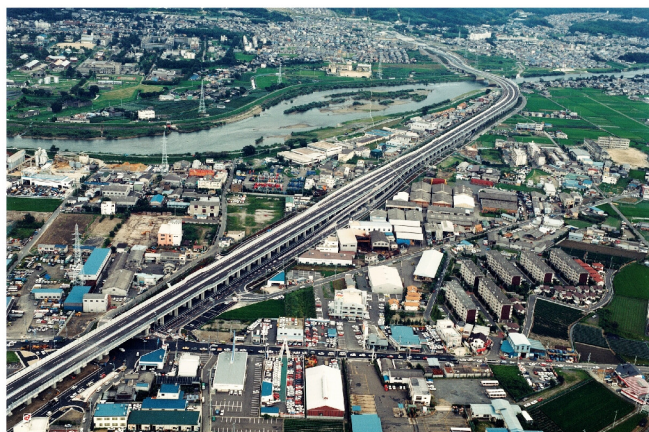
京滋バイパス 宇治西インターチェンジ工事

経済の高度成長やモータリゼーションの進展と共に、わが国の道路網は発達してきました。さらに、道路整備の成長期といえる今、全国各地で次々に道路建設が行われています。当社は、その中でも有数のビックプロジェクトに参画し、自ら蓄積した建設技術をもとに多大な貢献を果たしています。時代の先端を行くレベルの高い施工技術は高く評価され、当社の信頼の一角を築いています。