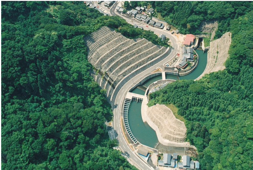
小規模河川水路トンネル改修道路改良合併工事

河川の水量確保や水害防止などを目的とした河川護岸工事は、さまざまな建設技術が必要とされる難易度の高い土木工事です。当社は、地盤改良技術や斜面安定技術、治水・利水技術、特殊杭打功法などの諸技術において、数々のダム建設で蓄積したノウハウを駆使し、質の高い工事を実施しています。また徹底した工事管理による合理化で安全性の高い作業体制も特色のひとつ。独自の技術と作業システムで、河川環境の整備を着実に進めています。