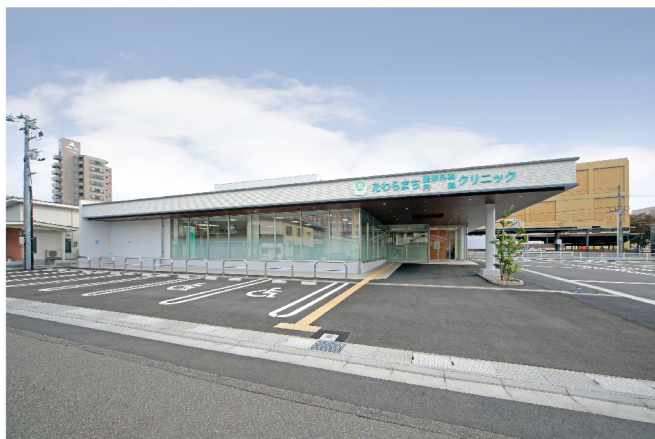
たわらまち整形外科・内科クリニック新築工事