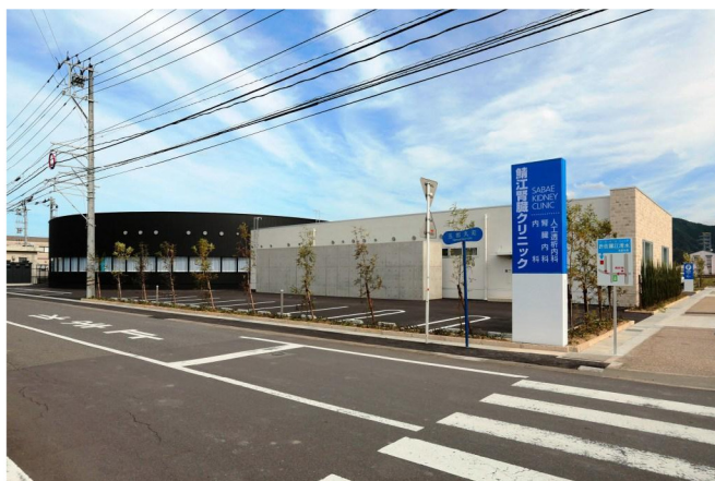
鯖江腎臓クリニック新築工事