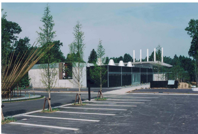
金津創作の森 整備事業センター施設建設工事