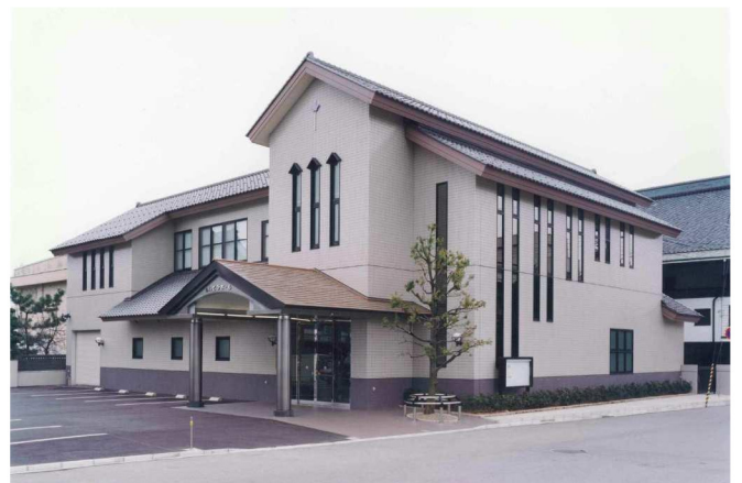
千福寺りんどうホール新築工事