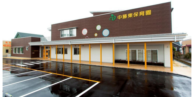
中藤東保育園新築工事