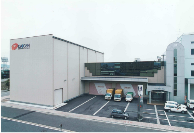
(株)ダイゲンコーポレーション