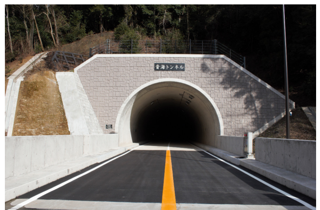
内浦トンネル工事 音海工区