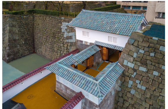
福井城櫓門 復元工事 ・ 山里口御門復元整備工事