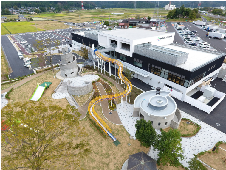
南条SA周辺地域振興施設新築工事（道の駅 南えちぜん山海里） 南条SA周辺地域振興施設公園改修工事・駐車場等整備工事

当社は、福井県など自治体の依頼により公共施設の建築を数多く担当してきました。コミュニティセンター、学校を始めとする教育施設など、質の高い施工技術を活かして建設された施設の数々は、地域住民にも親しまれ高い評価を得ています。これらの豊富な実績を基板に人々の多様なニーズに応えながら、未来に誇りうる共有財産としての建造物を目指し、より良い社会や文化の形成に役立っていきたくと願っています。