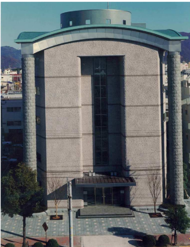
福井銀行福井中央支店新築工事