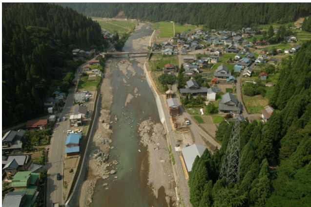
西天田地区護岸災害復旧工事 足羽川

河川の水量確保や水害防止などを目的とした河川護岸工事は、さまざまな建設技術が必要とされる難易度の高い土木工事です。当社は、地盤改良技術や斜面安定技術、治水・利水技術、特殊杭打功法などの諸技術において、数々のダム建設で蓄積したノウハウを駆使し、質の高い工事を実施しています。また徹底した工事管理による合理化で安全性の高い作業体制も特色のひとつ。独自の技術と作業システムで、河川環境の整備を着実に進めています。