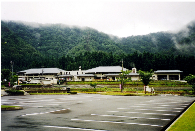
花はす温泉そまやま増築・改築工事