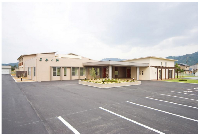
長寿の郷新築工事