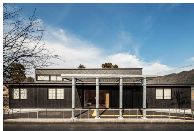
木漏れ日ハウス（デイサービス）新築工事