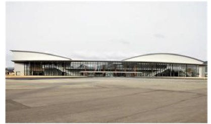
福井県営体育館新築工事