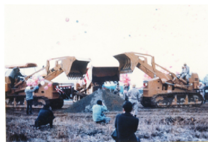
北陸自動車道着工