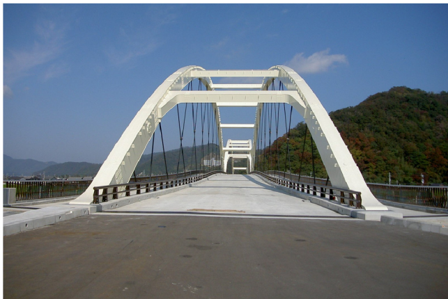
水鳥大橋建設工事

当社は、豊富な技術の集積をもとに、自然と調和する橋梁の建設工事を独自の施工で実現しています。