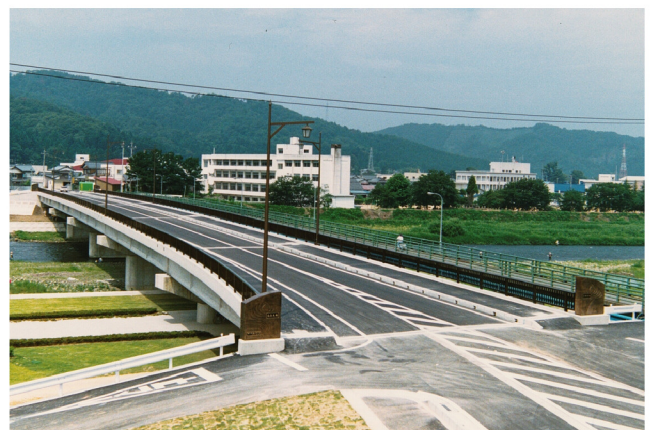
橋梁整備北山橋（南条大橋）