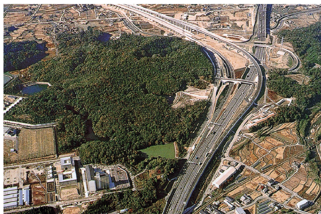
山陽自動車道 中高架橋西工事