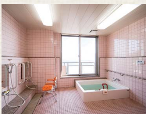
海を一望する普通浴室(上)と、リフト浴(右上)。