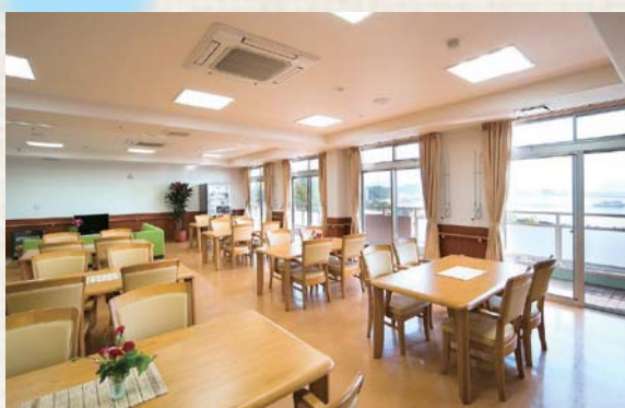
海見えるレストランのような雰囲気の食堂。夜は夜景も楽しんでいただけます。贅沢な気分を味わってください。