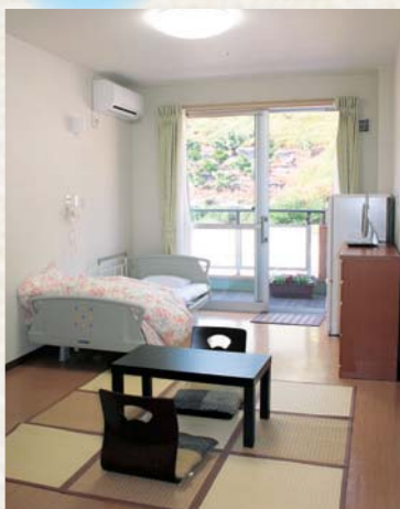
▲居室イメージ(山側)