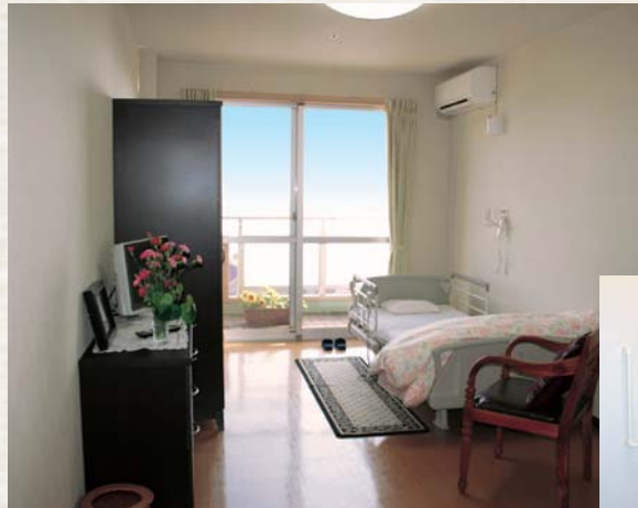
▲居室イメージ(海側)