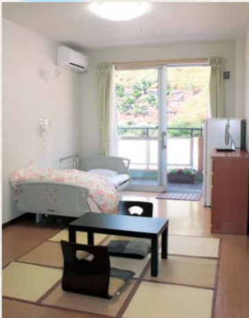
▲居室イメージ(山側)