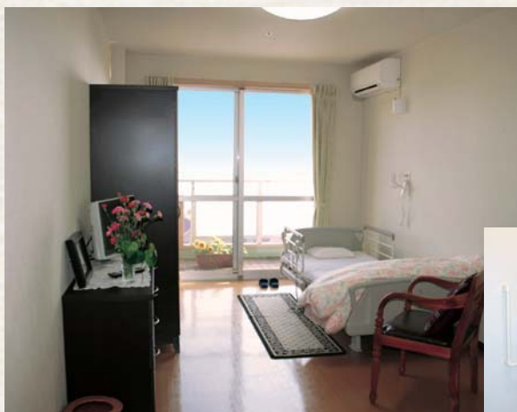
▲居室イメージ(海側)