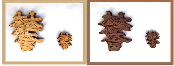
杉 M S ウォルナット M S