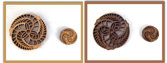
杉 M S ウォールナット M S