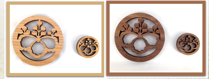
杉 M S ウォールナット M S