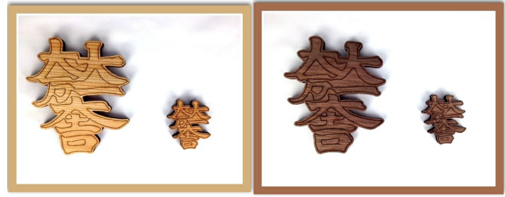
杉 M S ウォールナット M S