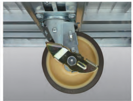
方向規制付きキャスター