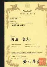
【防水膜施工装置】 【特許4243235号】