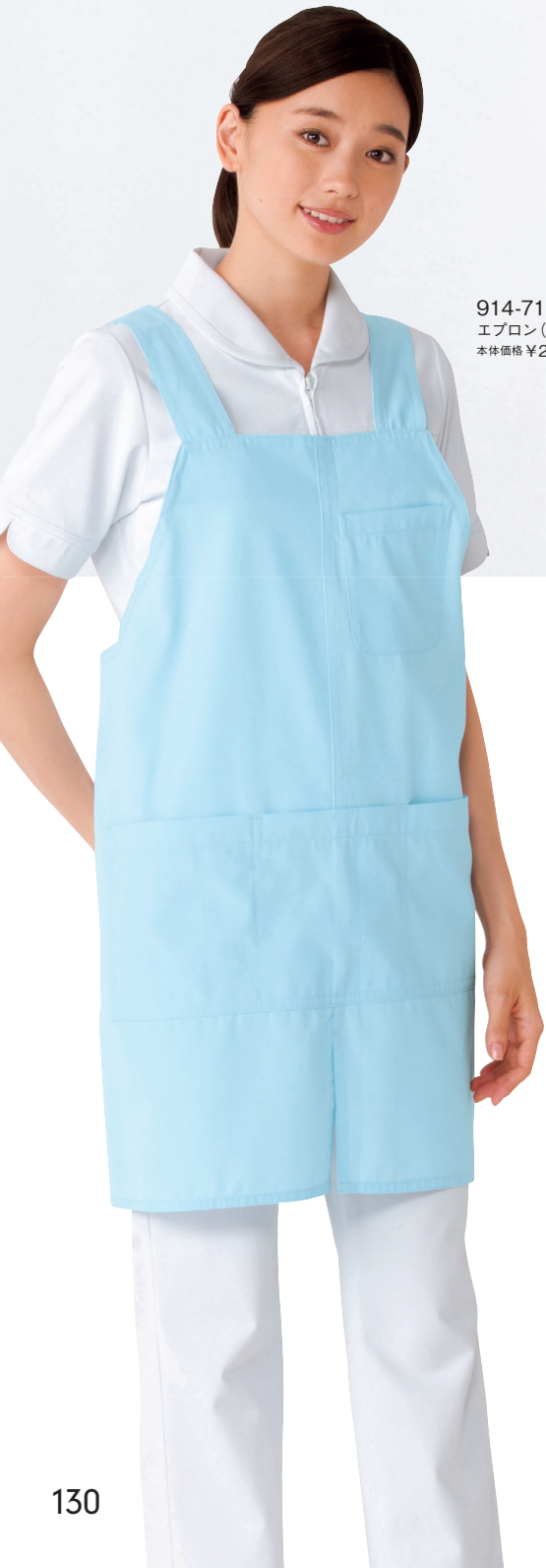
914-71 エプロン(サックス) 本体価格 ¥2,800+税