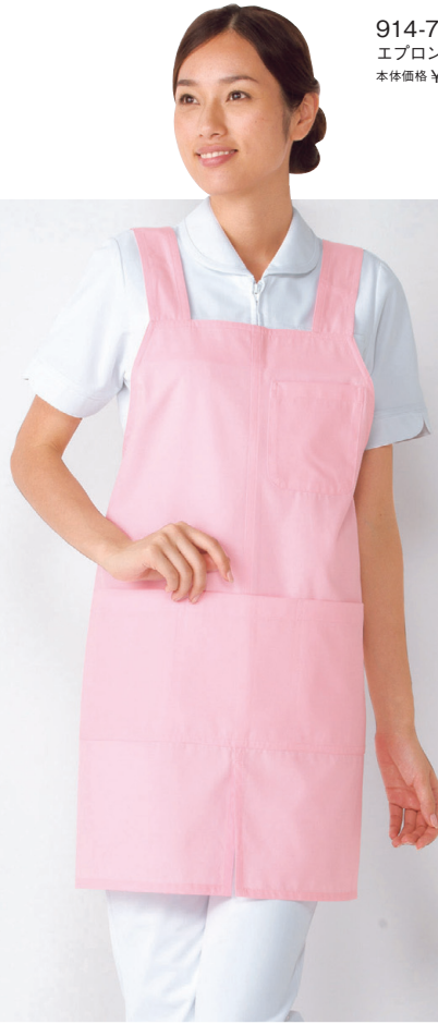
914-73 エプロン(ピンク) 本体価格 ¥2,800+税