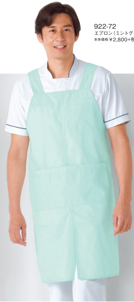
922-72 エプロン(ミントグリーン) 本体価格 ¥2,800+税