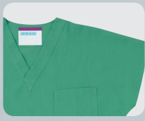
136-92 (グリーン) 本体価格 ¥4,000+税