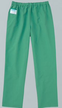
154-92 (グリーン) 本体価格 ¥4,400+税