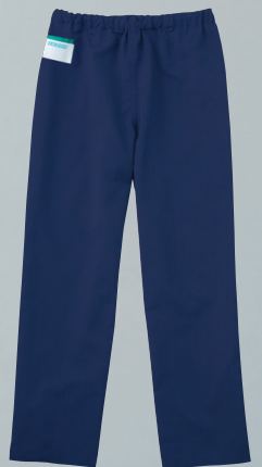
155-98 (ネイビー) 本体価格 ¥4,400+税