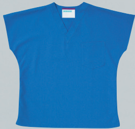
136-91 (ブルー) 本体価格 ¥4,000+税