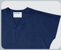
136-98 (ネイビー) 本体価格 ¥4,000+税