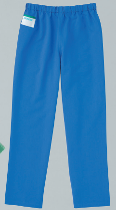
154-91 (ブルー) 本体価格 ¥4,400+税