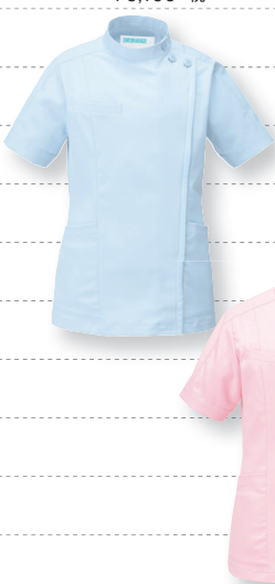
263-23 (ピンク) 本体価格 ¥6,100+税