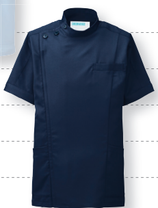
253-28 (ネイビー) 本体価格 ¥6,600+税