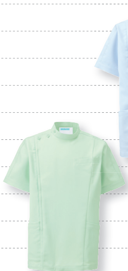
253-22 (ミントグリーン) 本体価格 ¥6,600+税