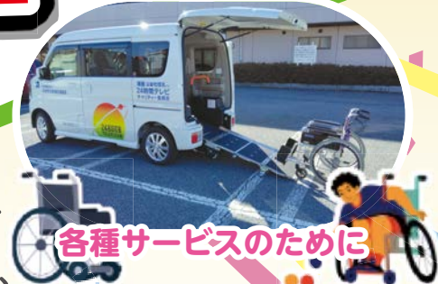
各種サービスのために

皆さまからご協力いただいた社協会費は、 町民の皆さまをはじめ、高齢者の方や 障がい者の方、生活に困窮している方など、 様々な福祉に役立てられています。 この他にも、様々な支援・サービスを行っています。 社協会員の加入にご協力よろしくお願ひします!