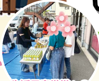
生活困窮世帯への 支援のために