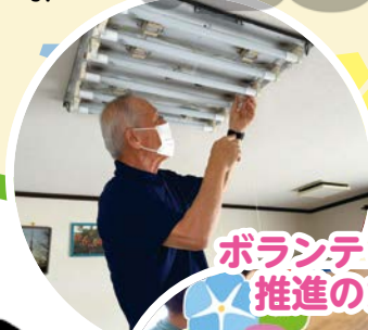
ボランティア活動 推進のために