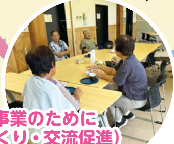
サロン事業のために (居場所づくり・交流促進)

社会福祉法人 松伏町社会福祉協議会 松伏町大字松伏357 電話 048-991-2700 FAX 048-991-5341 ホームページ http://www.matsubushi-shakyo.or.jp