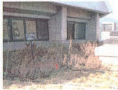
1 葉が茶色く枯れている。