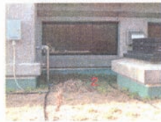
2 よく育っている。 外壁側の浴室排気の当たる場所 は特によく繁殖している。