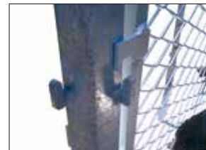
④かえしに引っ掛ける