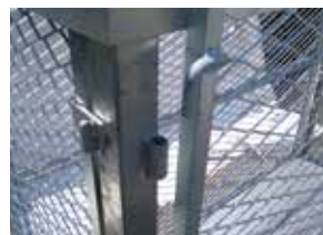
⑪フックを穴にはめ込む