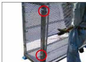
⑩前面扉を付ける(左右)