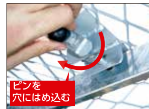
⑧ロックピンを回す