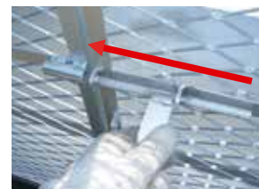
⑫取っ手を引いて完成