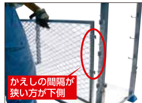
③裏面網を付ける(下)