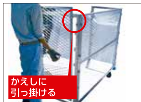
⑥側面網を付ける(左右)