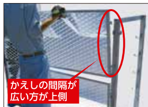
⑤裏面網を付ける(上)