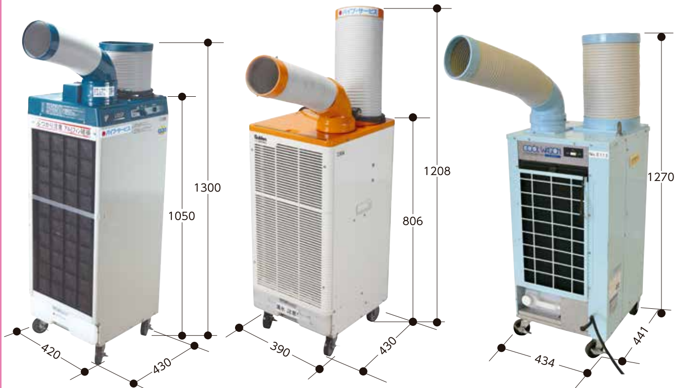
排熱延長用ダクトホース