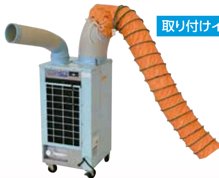
取り付けイメージ