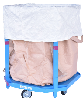
フレコンバッグ取付けイメージ

フレコンバッグを広げた状態で保管、移動 汎用品の1m 3 丸形フレコンバッグにも適合