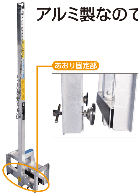
トラック取付けイメージ