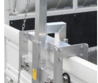
あおり取付けイメージ