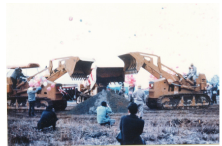
北陸自動車道着工